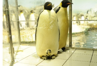
2013年誕生の赤ちゃん